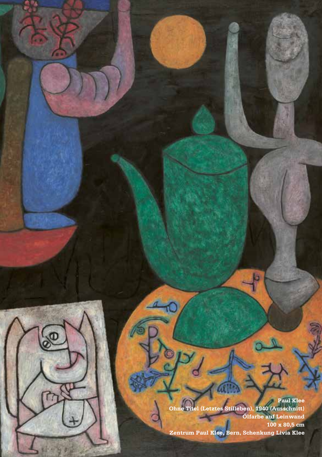
Paul Klee Ohne Titel (Letztes Stilleben), 1940 (Ausschnitt) Ölfarbe auf Leinwand 100 x 80,5 cm Zentrum Paul Klee, Bern, Schenkung Livia Klee