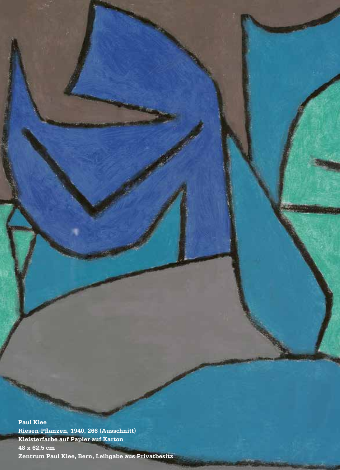
Paul Klee Riesen-Pflanzen, 1940, 266 (Ausschnitt) Kleisterfarbe auf Papier auf Karton 48 x 62,5 cm Zentrum Paul Klee, Bern, Leihgabe aus Privatbesitz